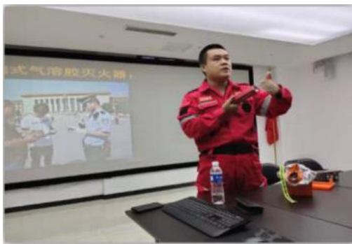
★公司消防安全培训