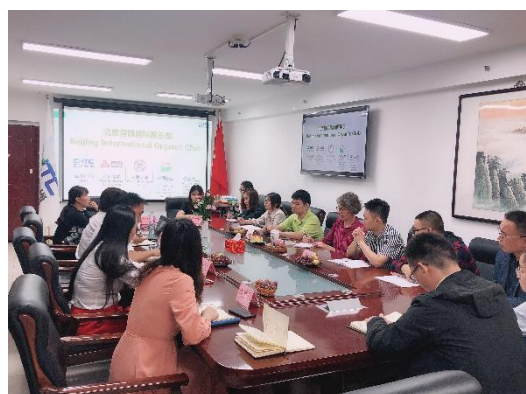
★图为参加低碳环保科研课题

引进低碳环保人才，积极参与低碳农业课题研究，利用自身资源和技术优势，在科研、技术和试验示范上狠下功夫，提供更专业的服务。发展有机农业，按照有机生态环境循环理论，通过有效利用畜禽粪便，不使用化学肥料和农药，不焚烧秸秆等手段，达到节能环保的效果。