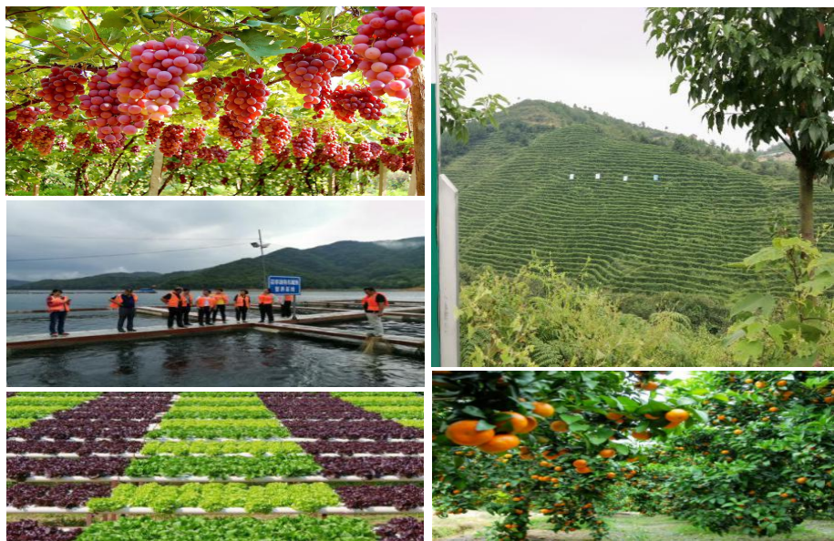
★图为有机示范县认证产品展示