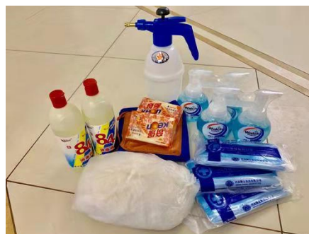
★公司发放的疫情防护用品

为了保障审核员/检查员的健康安全,减少审核/检查过程中可能发生的接触风险,公司专门采购了一批疫情防护用品,如:口罩、手套、免洗洗手液、84 消毒液、喷枪、酒精棉等,给在外奔波的老师带去了公司的关怀,让大家在外工作能感受到家的温暖。