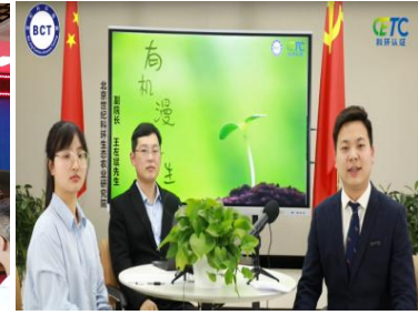
★公司有机漫人生栏目