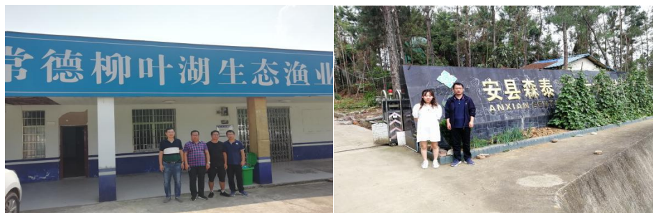
★图为检查员在企业基地现场检查