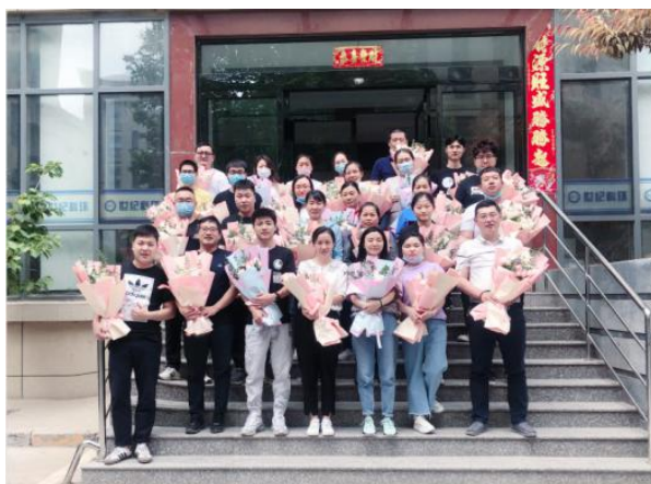
★ 520 节日福利

2020 年的三八节、六一节、520 日、端午节、中秋节、春节、元宵节等，我机构均为员工发放过节福利。