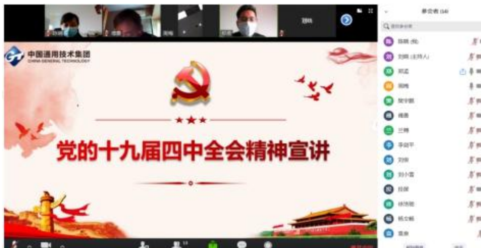
学习贯彻党的十九届四中全会精神

2020 年公司积极开展学习贯彻习近平新时代中国特色社会主义思想和党的十九大精神活动，学习贯彻十九届四中全会、五中全会精神和中国汽研的党的建设和党风廉政建设精神，并制订了年度学习计划，按月开展了支部学习活动和党日活动。组织全体党员学习了《中国共产党基层组织选举工作条例》、习近平总书记重要文章《贯彻落实新时代党的组织路线不断把党建设得更加坚强有力》、《习近平谈治国理政》第三卷等重要内容学习；要求全员参加检测事业部组织的全体党员培训，并通过闭卷考核学习情况，平均得分 97.2 分。