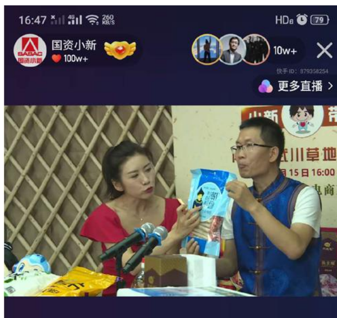
参与消费扶贫活动

3) 2020 年 11 月 6 日, 为响应国家号召, 践行落实扶贫工作, 宣传助力扶贫事业, 在重庆市委办公厅及扶贫集团的大力支持下, 经前期有效沟通和协调, 石柱县扶贫产品顺利在我公司开展第一期周末集市。本次推介和售卖的物资涉及散养土货、鸡鸭猪肉等生鲜食品及其他加工食品等数十余种。