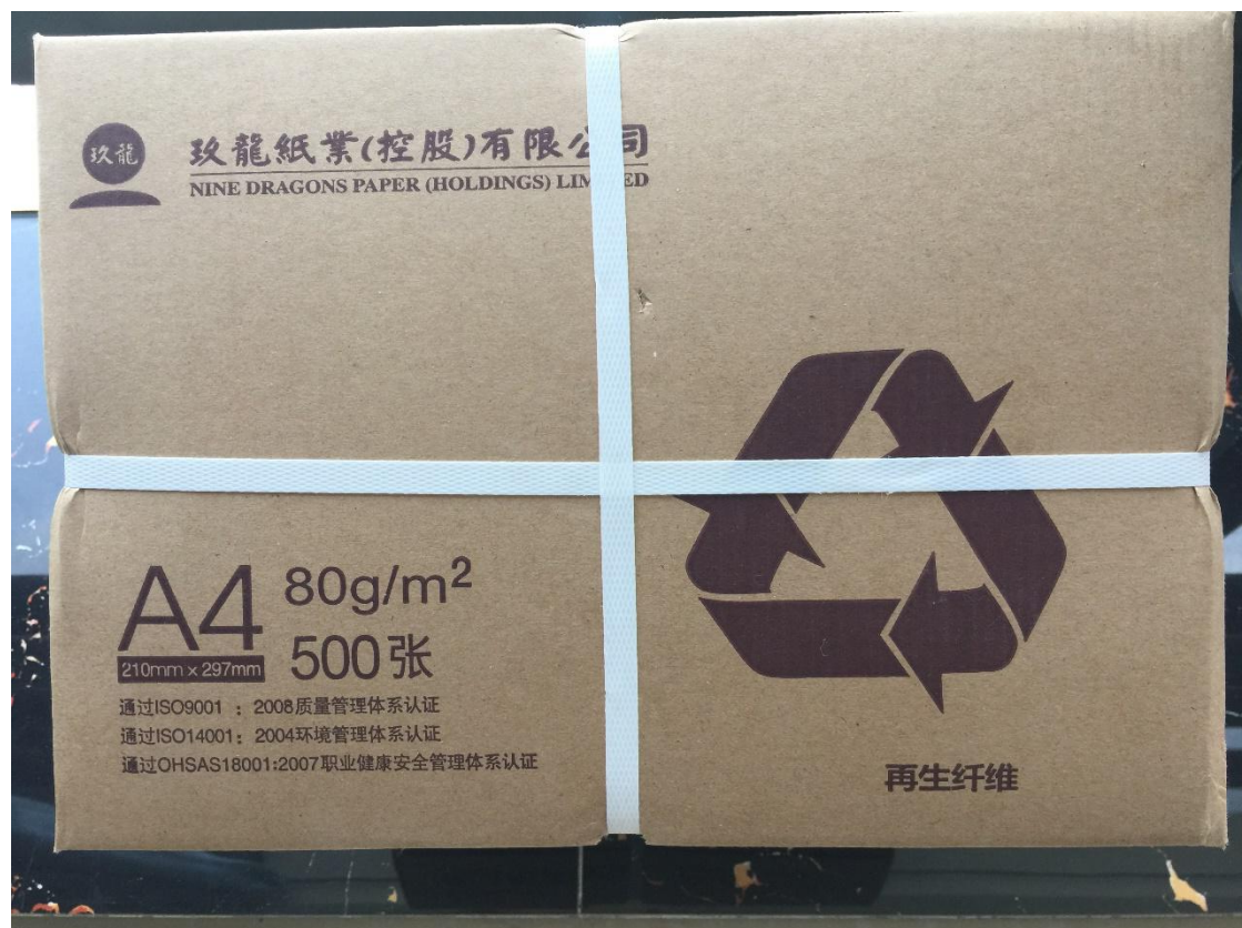
（公司的办公用纸为再生纤维办公用纸）

文件的发送、接收均实现了电子化，这样既带来了工作的便利，也节约了纸张。公司从采购环节入手，确保购买的办公用品应为环保产品，如：目前，公司的办公用纸为再生纤维办公用纸，用量控制不超过12箱/月，每箱净重20KG，每年就是260KG；这些办公用纸的原料均是废纸，如此，相当于使得5棵大树免于砍伐，以节能降耗为宗旨。公司的办公地点的选择也有另一层用意，意在节能、意在环保。选在了采光良好的23楼，在晴天，不使用照明电就可以保证有充分的亮度，工作时间内靠幕墙一侧的办公区，是不需要开灯的。且在日常的办公过程中，做到人走电断，尽量节约能源。