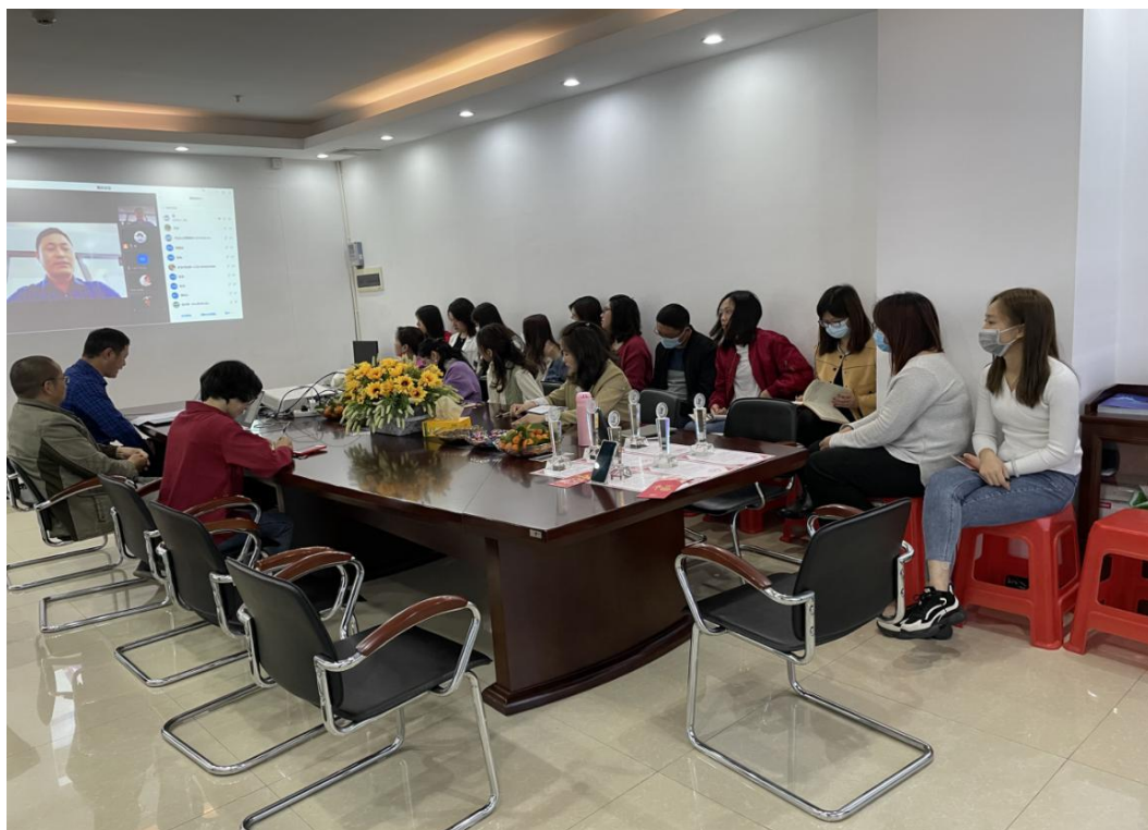
（2020年年终线上年会，给优秀员工颁奖）