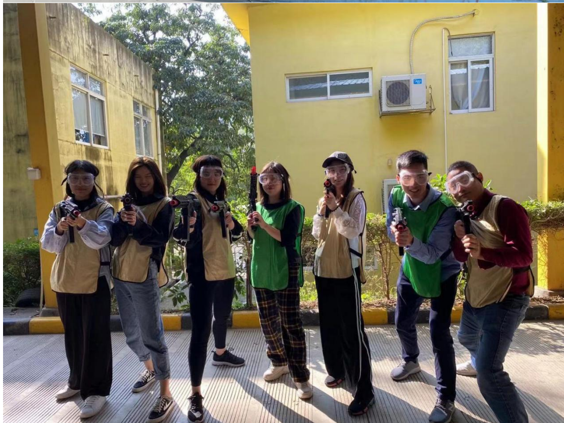
(2020年12月开展户外团队拓展活动，增强团队凝聚力)