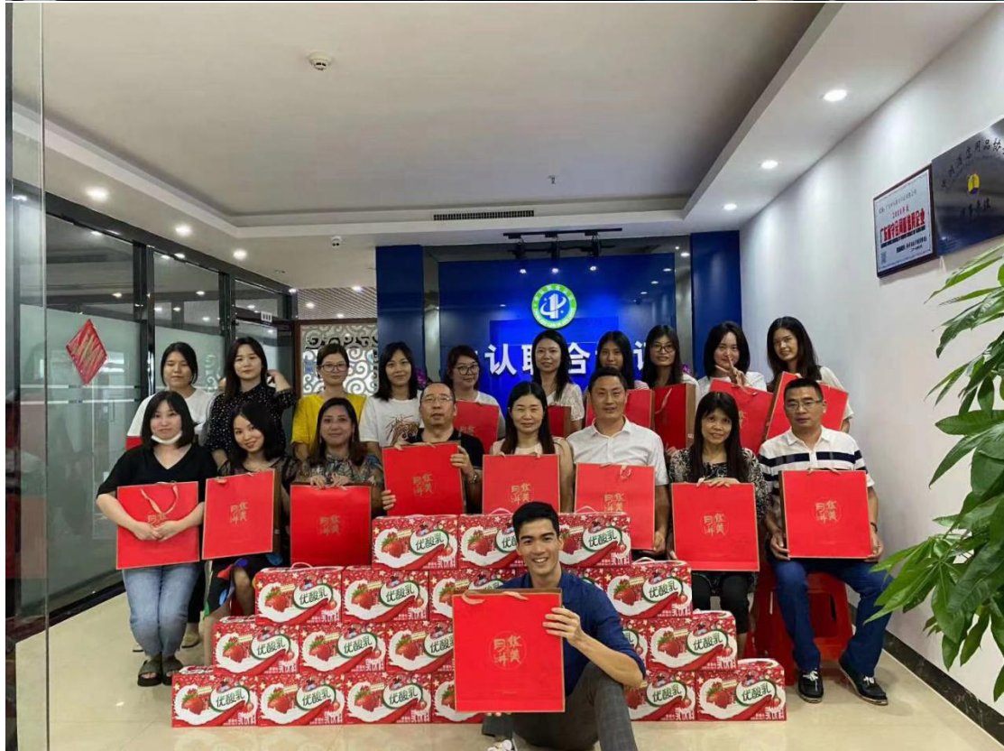
(2020年中秋节员工聚餐，且发放节日福利)