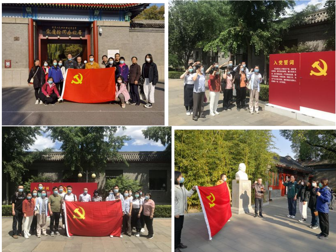
多种形式的主题教育活动

做好疫情防控的前提下继续开展多次党员活动。组织党员参观了北京鲁迅博物馆、宋庆龄故居等，继续以党员过集体政治生日、重温入党誓词等形式提升党员的责任感和使命感，用伟人的精神不断增强党员的爱国情怀。