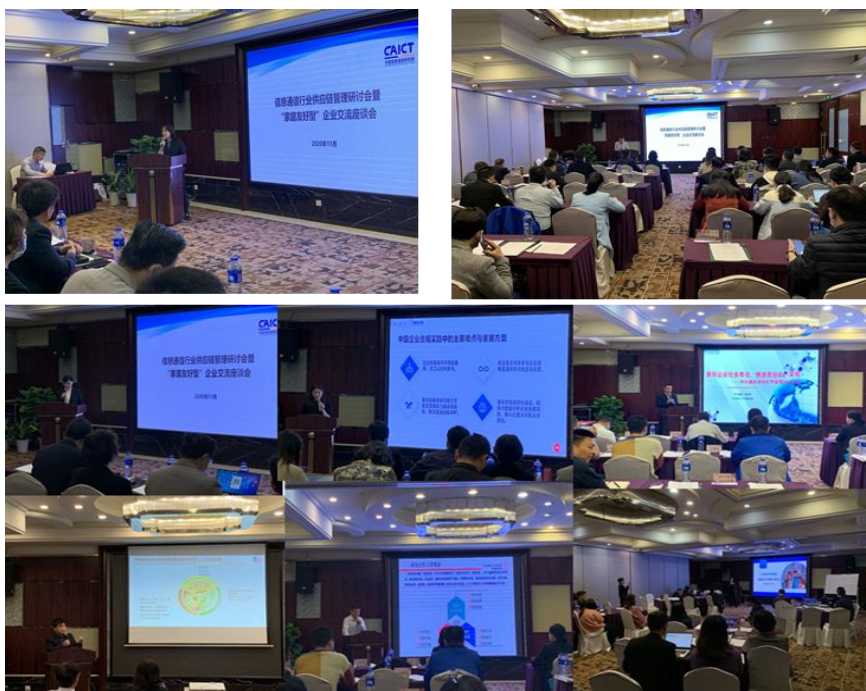
“家庭友好型”企业交流座谈会暨信息通信行业供应链管理研讨会