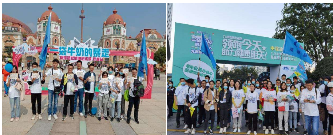
参加一袋牛奶的暴走公益活动