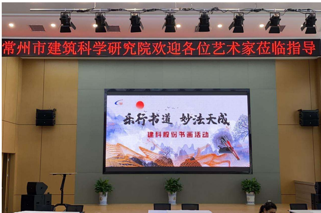
参加足球、篮球赛，书画活动