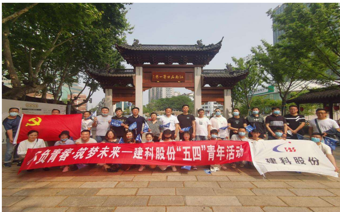
不负青春、筑梦未来——建科股份“五四”青年活动

积极参与社会公益事业和社区建设，鼓励开展认证认可志愿者活动或志愿服务，关心支持教育、文化、卫生等公共福利事业。