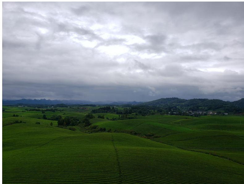
2020 年 9 月“跟着青蛙走”活动走进湄潭茶园