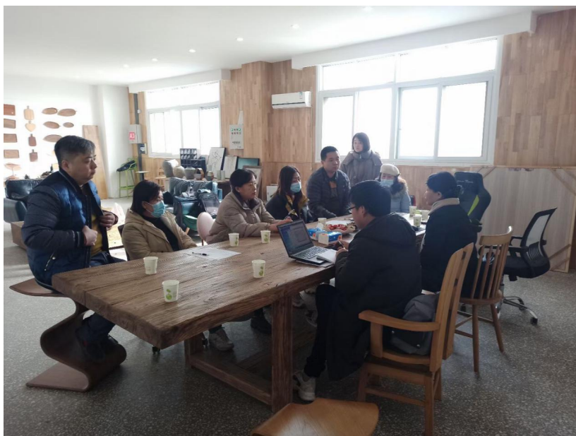
绿色产品认证审核现场