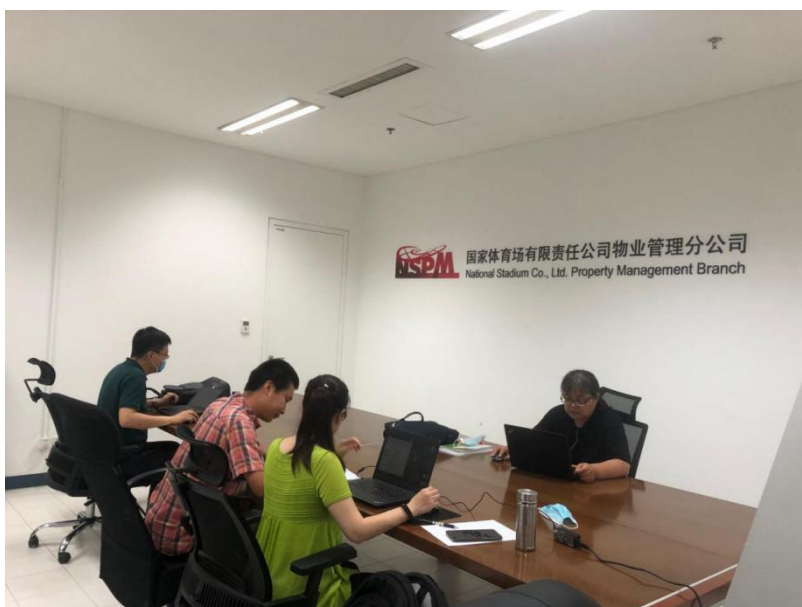
国家体育场质量管理体系现场检查

2020 年，中标合信先后为国家体育场有限公司（鸟巢）、北京燕京啤酒股份有限公司、北京工业大学等进行了体系认证，在体系认证实施的同时，中标合信努力成为企业信赖的合作伙伴，帮助企业改善了管理水平，提高了客户满意度，提升了国内外知名度和影响力，为推动企业国际贸易，提高产品质量的管控能力发挥了重要作用，这也间接的为推动社会经济可持续发展作出贡献。