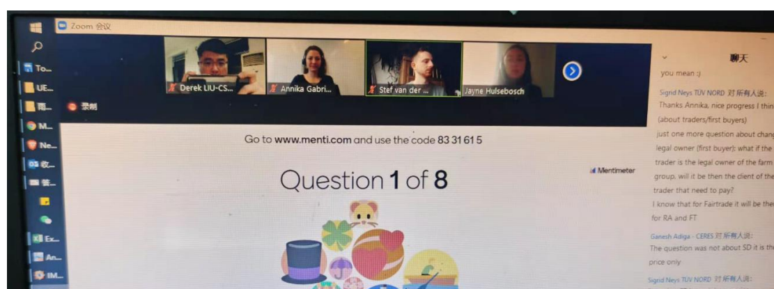
雨林联盟可持续农业标准 2020 年版本更新及认证实施培训会

2020 年 11 月，雨林联盟组织了“可持续农业标准 2020 年版本更新及认证实施规则”的在线培训，为期 10 天。中标合信国际认证师全部参加，加深对雨林联盟新版标准及认证体系的理解。此次培训，有助于中标合信在新标准 2021 年 7 月生效后，持续为新老客户提供优质、专业、可靠的认证服务，为保护自然生态环境、提高人类福祉以及应对全球气候变暖尽微薄之力。