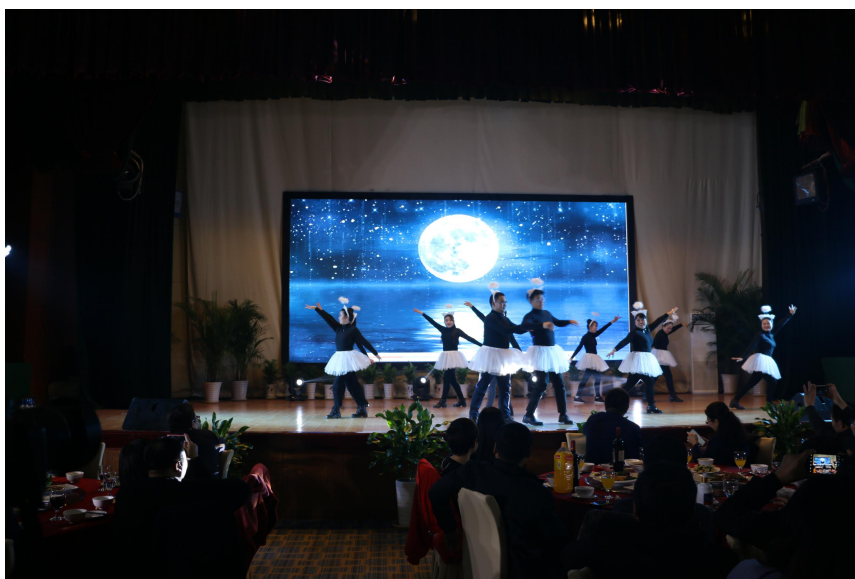
中泰联合认证有限公司 2020 全员参与春节团拜会