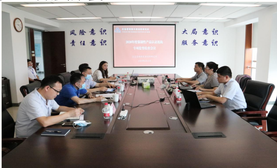
▲2020 年 8 月资质变更后迎接国家认监委年度专项监督

作为强制性产品指定认证机构，天津所认证机构依法依规开展各项工作并自觉接受认证行业主管部门的监督管理。 一是 按时完成原工程中心认证机构“认证认可统计上报”、“认证机构年度报告”、“社会责任报告”、“指定实验室检测质量评价数据”等质量数据上报。 二是 严格按照有关规定申请完成原国家消防工程技术研究中心认证机构资质注销工作。 三是 机构强制性认证工作顺利通过国家认监委 2020 年度 CCC 专项监督检查。