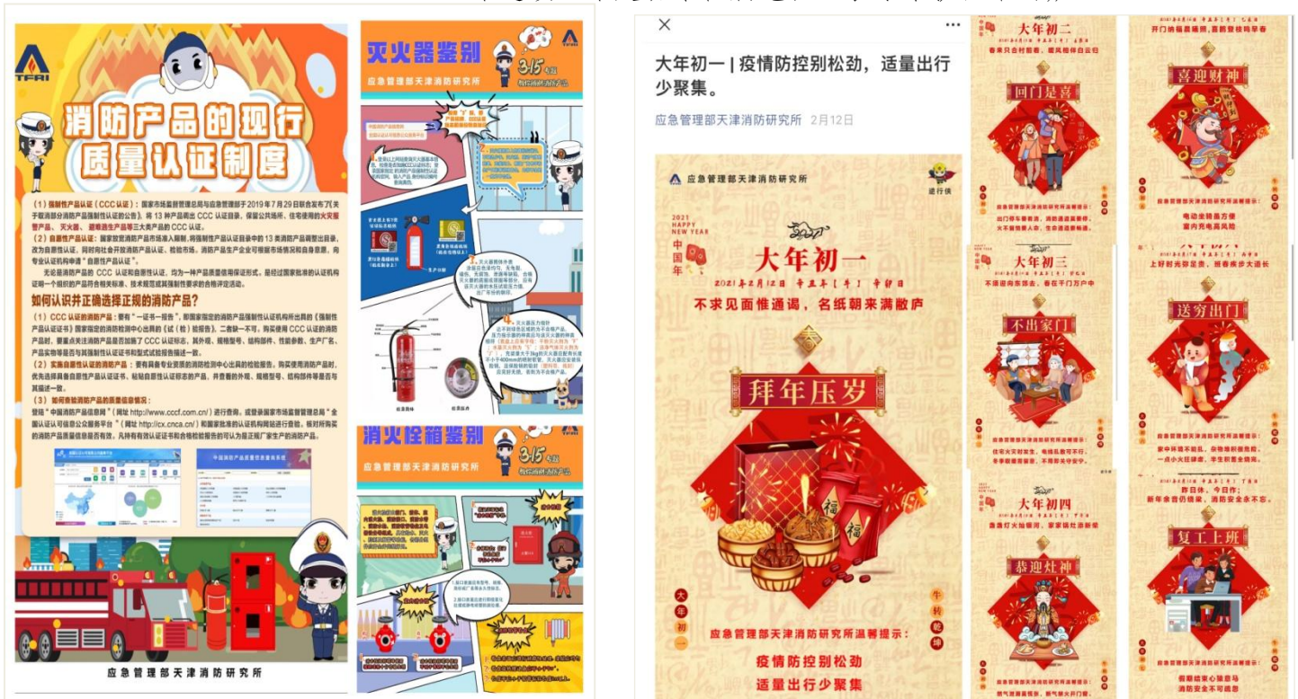
▲参与制作2021年春节消防救援科普和“3·15消防产品质量科普”