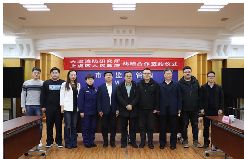
▲ 2020 年与绍兴市上虞区人民政府、上虞区市场监督管理局展开合作