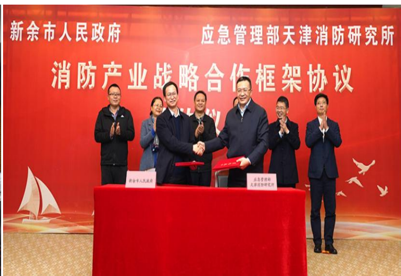
▲ 2020 年与新余市人民政府签署战略合作协议