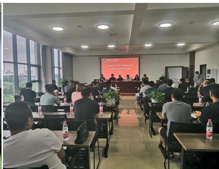
▲2020年赴福建、浙江、江苏、山东、陕西、四川等地开展“提质增效服务行动”