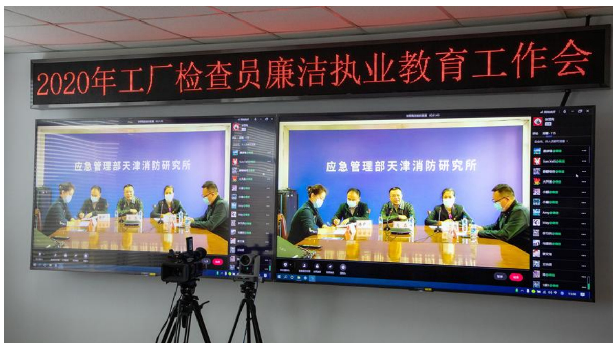
▲2020年11月参加年工厂检查员廉洁自律专题教育工作会