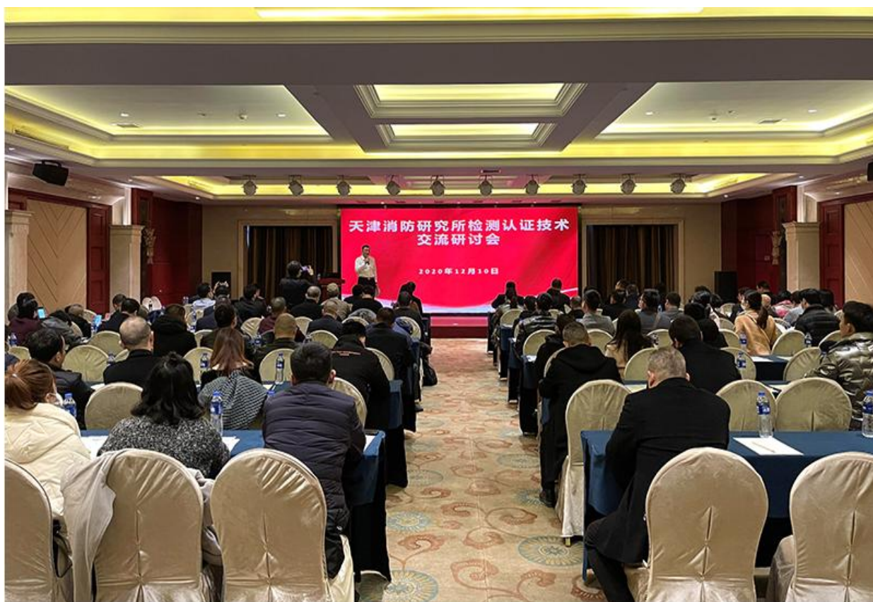
▲2020年12月在南昌成功举办检测认证技术交流研讨会