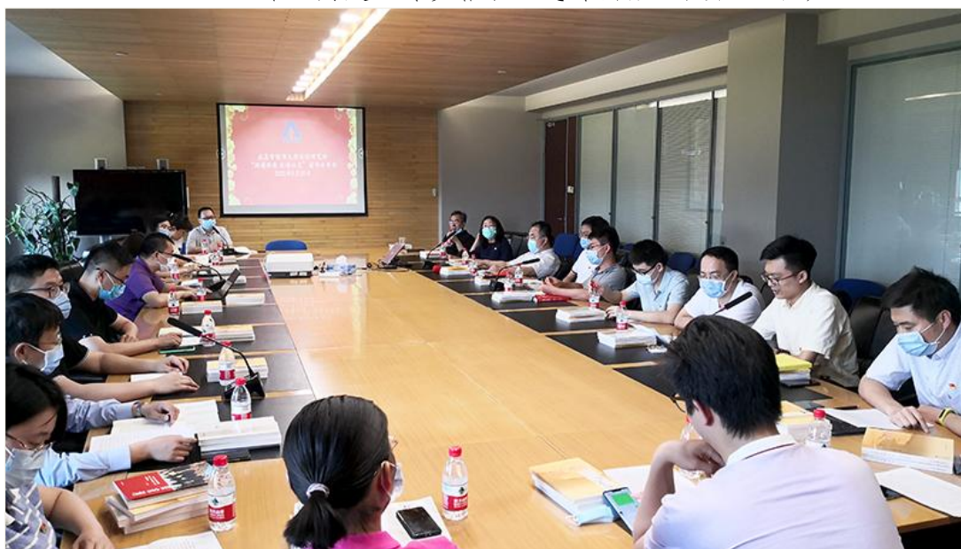
▲2020年5月参加读书分享会