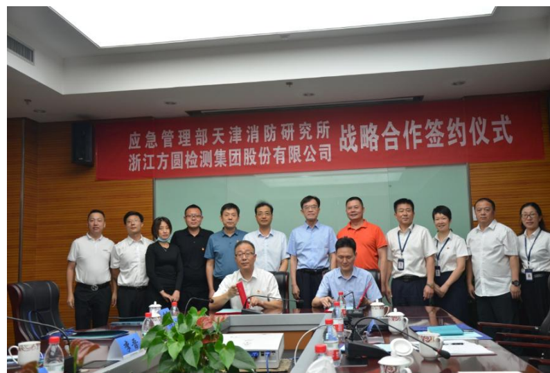
▲ 2020 年与浙江方圆检测集团股份有限公司展开合作