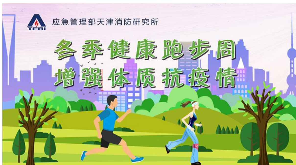
▲2020年11月参加全所线上冬季健康跑活动