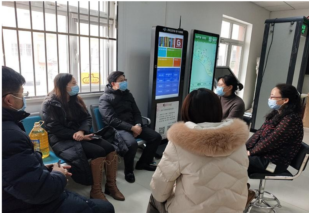
▲2021年连续3年走访单位属地社区联系帮扶困难群众

5.立足公益属性，服务社会大众。发挥自身优势，积极参加消防产品科普、困难群众帮扶和社区宣传服务等社会公益活动。