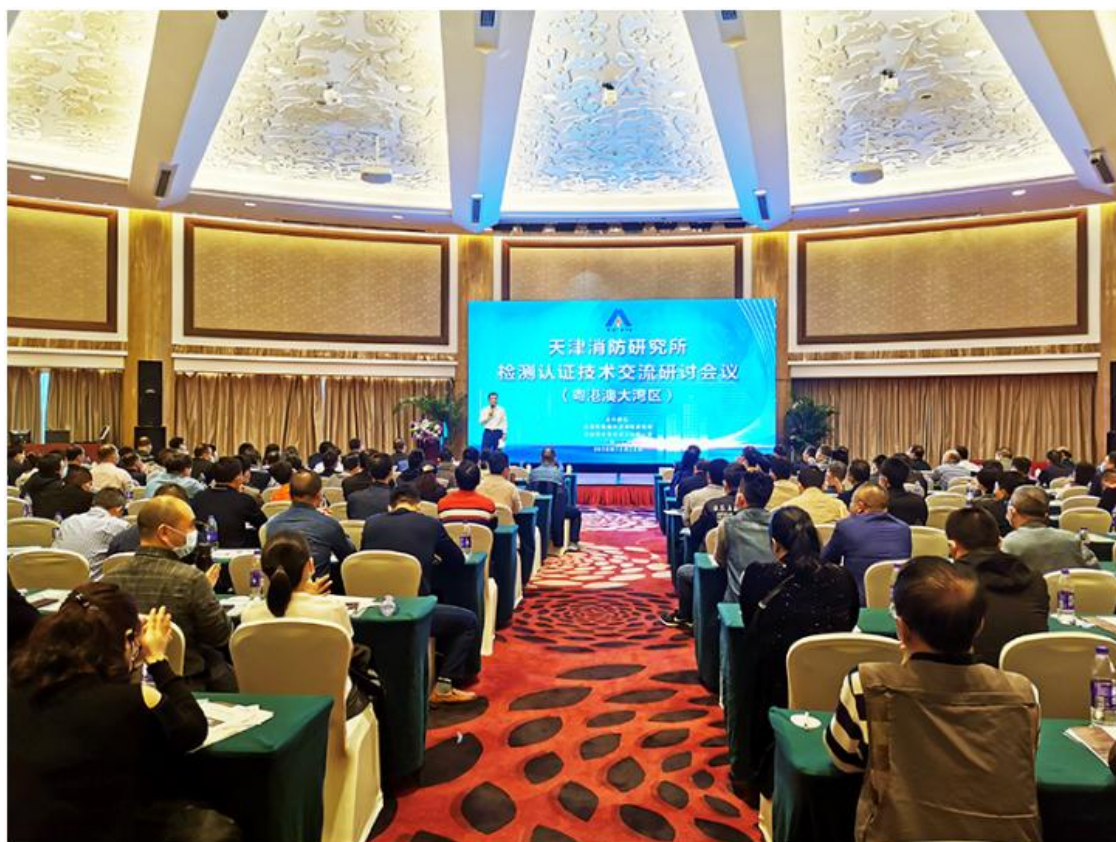
▲2020年12月在广州组织召开检测认证技术交流研讨会（粤港澳大湾区）