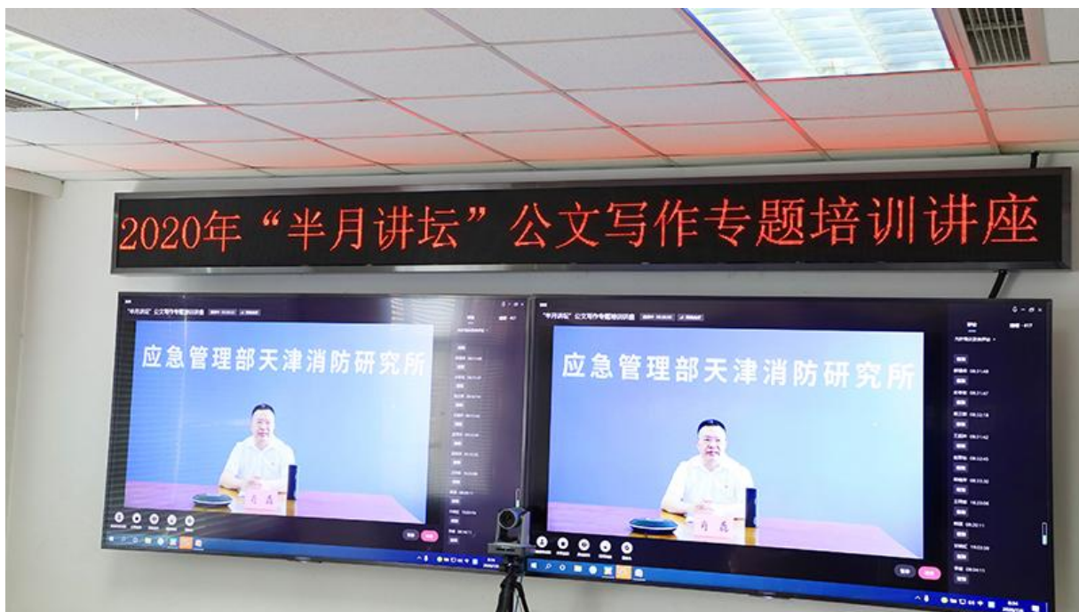
▲2020年7月参加半月讲坛公文写作专题培训