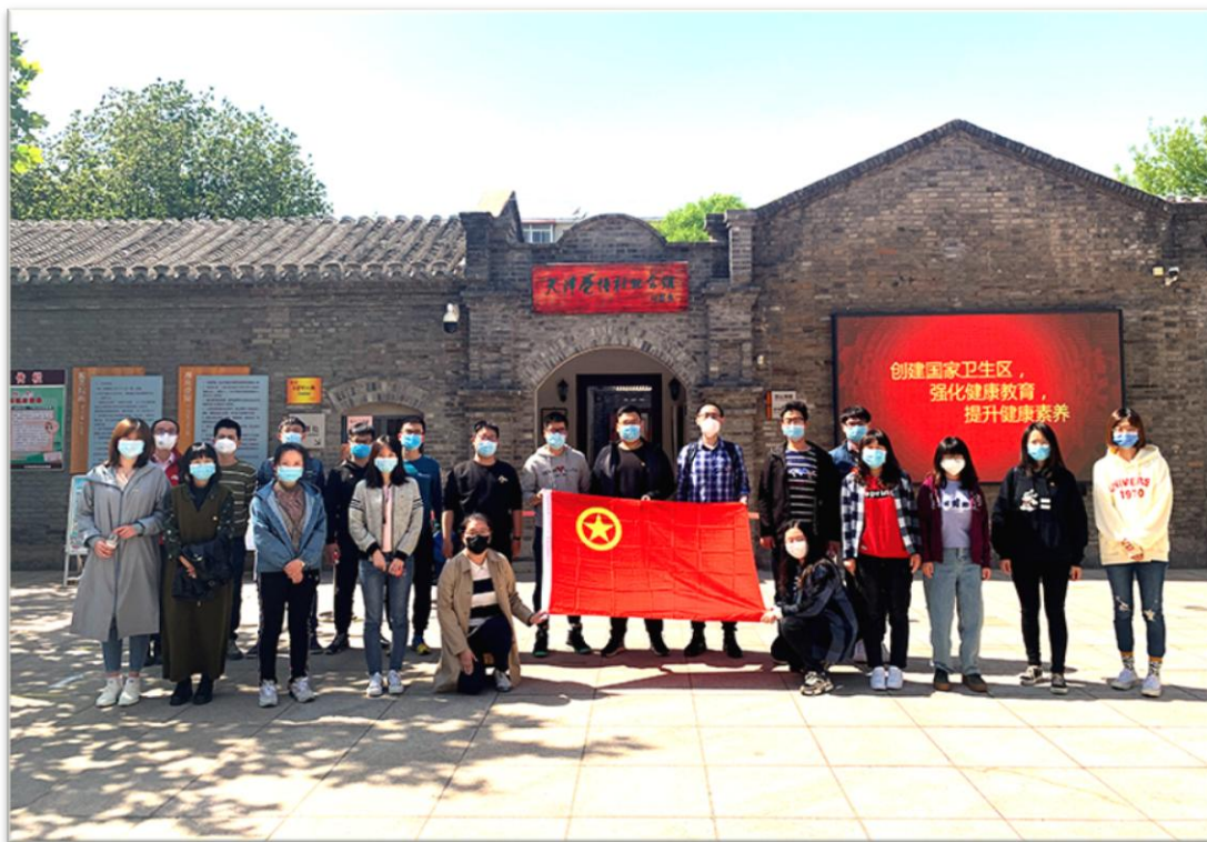
▲2020年4月赴天津觉悟社纪念馆开展主题团日活动

4.切实关爱职工，凝聚团队合力。结合天津所党政工团妇等组织优势，重视人文关怀，强化服务保障，广泛组织机构职工，特别是青年职工参与所内各项理论学习、文体实践和表彰活动，定期聆听基层职工建议意见，切实解决职工需求。