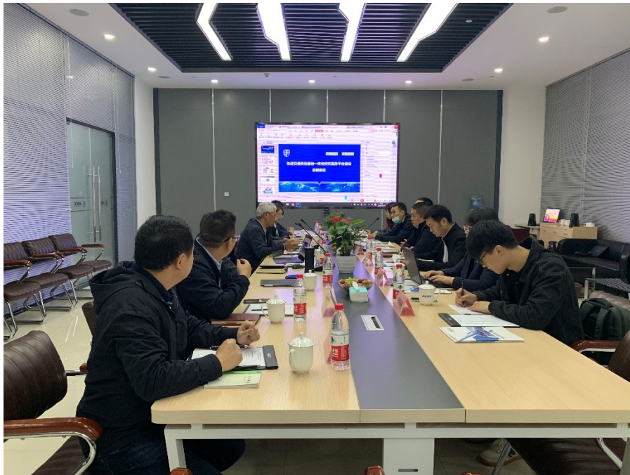
NQI 一体化平台建设学术研讨会

同时作为合格评定机构引领西南交通大学轨道交通“计量-标准-合格评定”NQI平台建设，通过政产学研紧密合作方式，对给予NQI一体化建设给予强有力的支撑。