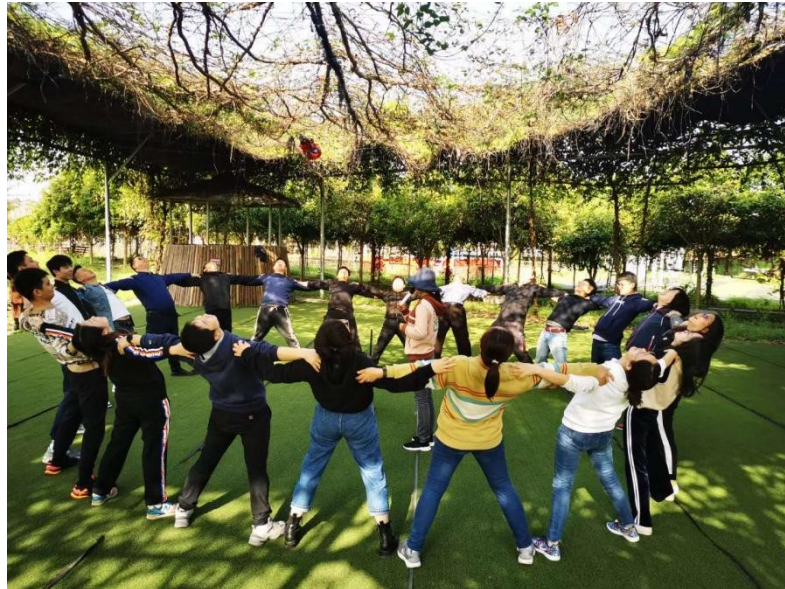
员工开展室外拓展活动

JRCC 始终秉持“人才文本、德才兼备、唯才是举”的企业人才观，为增强组织凝聚力、战斗力，进一步强化全员的团队意识和合作精神，释放工作压力，所有员工均有机会参与公司定期或不定期举行的各项活动，如：聚餐、户外拓展等，女职工享有三八妇女节聚餐及带薪休假。