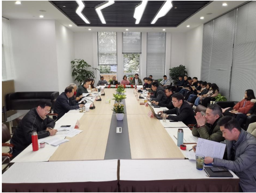
轨道交通质量提升座谈交流会