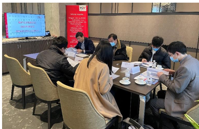
图一：公正性委员会研讨会