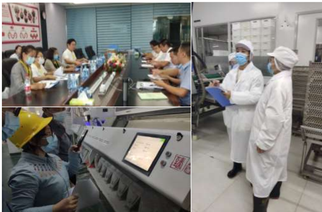
部分现场审核场景