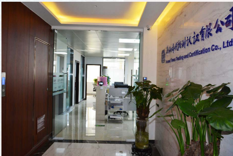
华纳公司位于大学科技园（东园）的办公场所

华纳时代的发展和进步离不开社会各方面的支持。我们在继续践行“责任·使命·担当”的企业精神的同时，用“合作共赢、全心服务”的经营理念、“改变从今天开始”的人力资源建设观，持续提升公司的社会责任承担能力、服务能力、人才理念，以创新、开放、包容的心态谱写华纳时代新篇章。