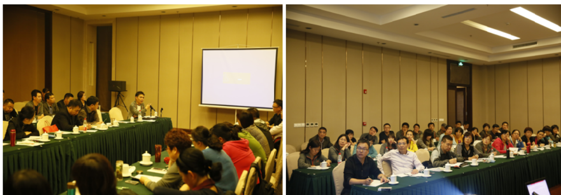
培训及拓展训练活动