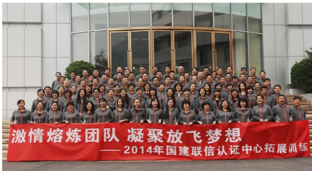
培训及拓展训练活动