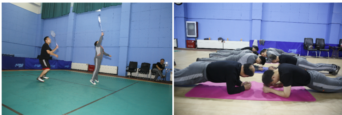
工会组织的体育活动

我机构工会和党支部定期开展活动，鼓励员工积极进行体育锻炼，增加了员工的归属感，也增强了员工之间的沟通。