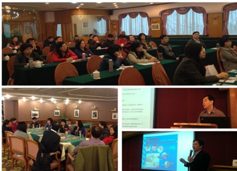
2014 年 3 月份审核员培训