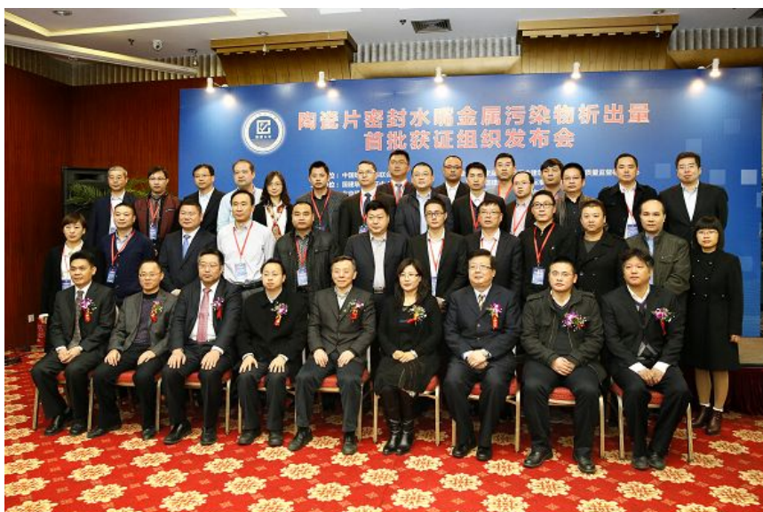
与会领导和获证组织代表合影