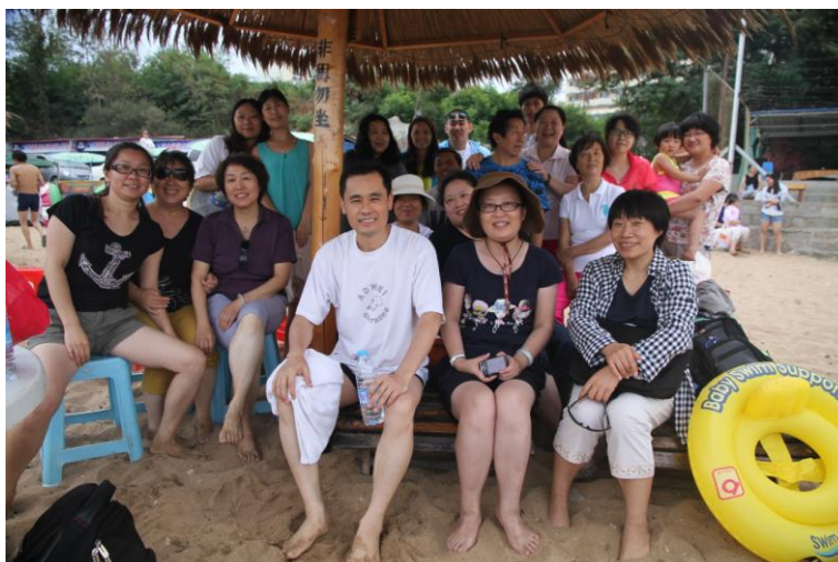
组织员工去海边避暑

5.3拓宽通道，促进员工成长。神舟不断创新人才选拔和培养机制，吸引和培养了一大批管理和技术骨干，有效促进了神舟的团队建设；同时，也为青年员工职业发展提供了更多选择与可能。在管理人员和审核人员中开展岗位练兵、继续教育和评比“优秀审核员”等形式的活动，并提供技术交流和学习机会。神舟努力为员工营造积极向上、爱岗敬业的工作氛围，倡导“同心、同德、同路、同行”的事业精神，开展了爱国、爱党、爱事业教育活动，神舟建立了“家”的氛围工作环境，使员工真正体验到了“家”的温暖与和谐。