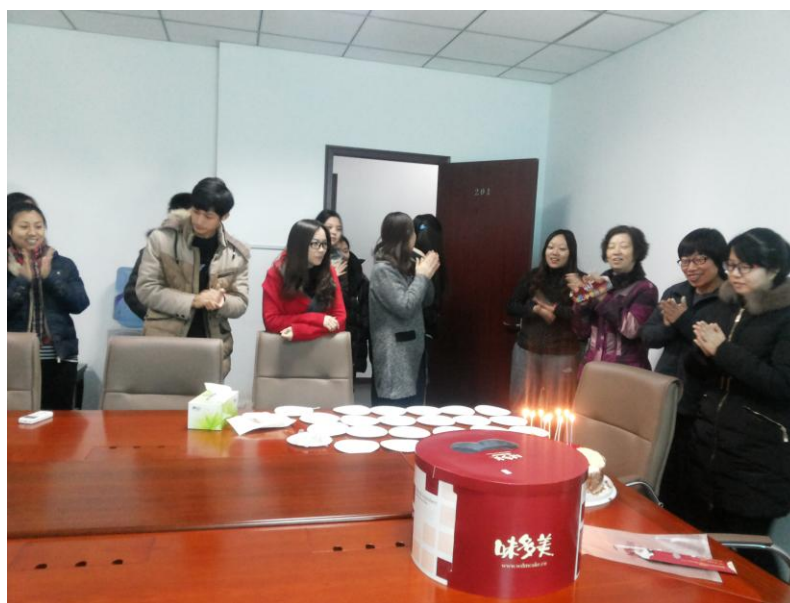
中心提供生日蛋糕给过生日的员工

5.2尊重员工，保障合法权益。神舟严格遵守《劳动法》、《劳动合同法》等各项法律法规，切实保障员工的合法权益：关于劳动时间与劳动保护：执行国家规定的劳动作息时间，为员工提供相应的劳动保护和舒适的工作环境和办公条件；关于人权与强迫劳动：尊重员工人权及其他权益，确保员工在自愿的基础上签订或续签劳动合同、参加工作，禁止非法限制人身自由和强迫劳动；关于知情权与沟通机制：神舟通过员工小组、各级员工座谈会等不同方式或措施让员工参与或了解公司的决策；关于薪酬福利与保障：神舟从自身实际出发，结合行业及实际情况，为员工提供了人性化的福利；在为员工提供法定社会基本保险的同时，还提供相应的补充商业保险，以最大限度地保障员工权益；关于休假：为员工提供带薪年假，并不定期组织不同形式的员工集体活动，以增进员工的凝聚力与向心力。