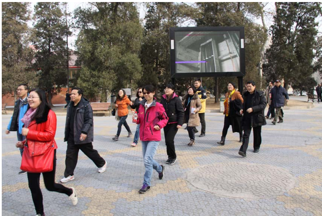
图为员工参加健步走活动