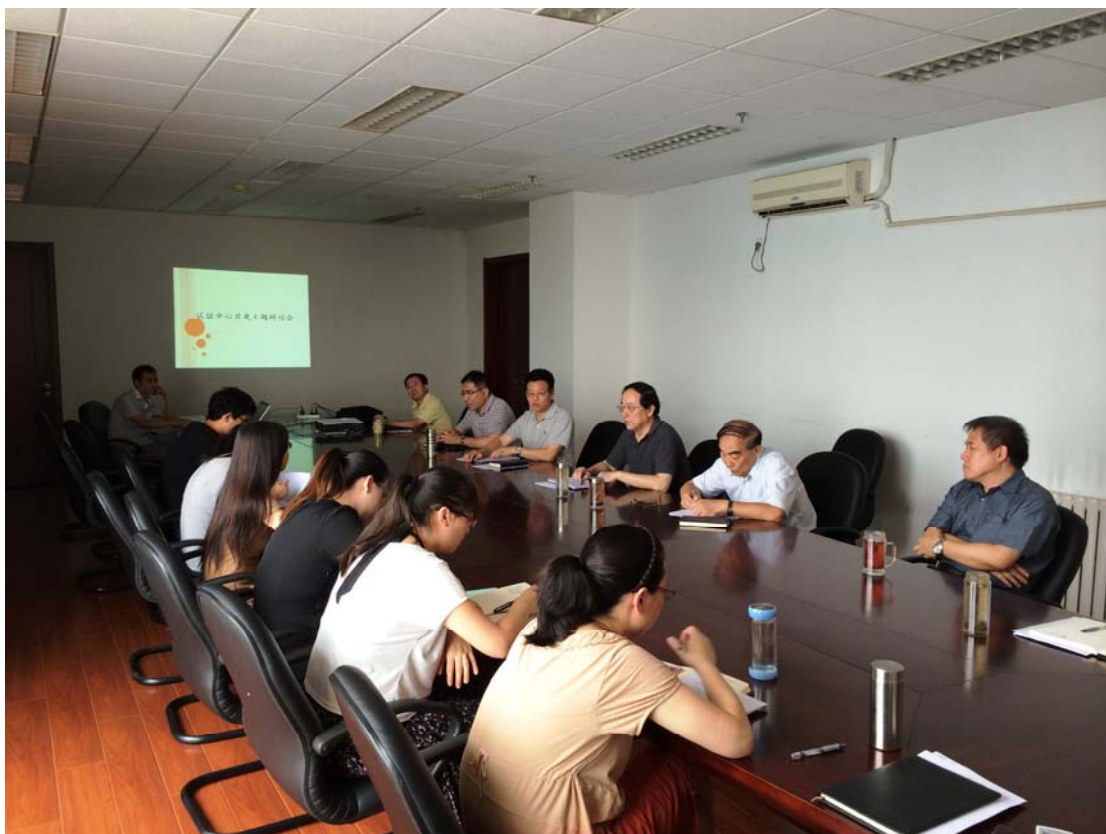
图为中心组织内部培训和年度培训