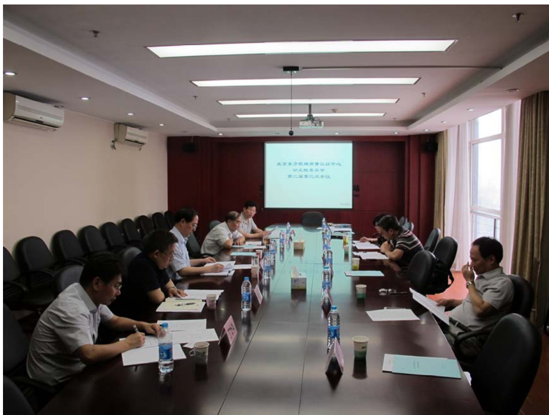
图为中心开展公正性委员会会议

公正性委员会认为中心不存在影响公正性的财务压力，2013 年中心认证工作规范、认证收费符合要求，从认证项目受理、审核员选择、认证项目实施过程、认证决定和认证审批结论符合认证公正性要求。