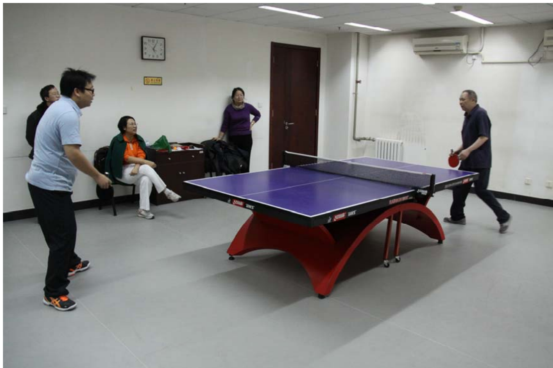
图为员工参加乒乓球比赛

关于休假与体检：为员工提供带薪年假和每两年组织一次职工健康体检。积极组织员工参加投资母体组织的运动会和农业部组织的健步走活动等员工集体活动，以增进员工的凝聚力与向心力。